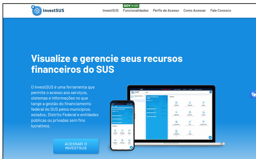
Figura 2: Página inicial do Sistema InvestSUS/Ministério da Saúde

O Estado da Bahia apresentou no início do processo de Retomada de Obras, em janeiro de 2024, 47 de polos do Programa Academia da Saúde, elegíveis para a retomada de obras. A primeira etapa, de manifestação de interesse, finalizada no dia 22 de